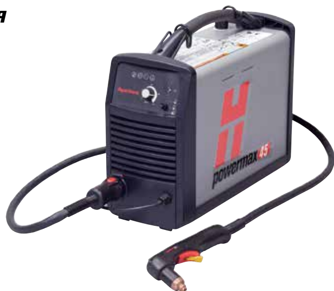
Ручной резак Т45v