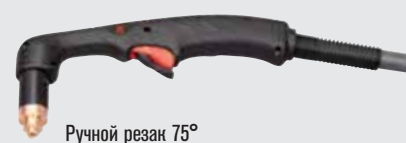
Ручной резак 75°

(дополнительные варианты резаков см. на веб-сайте www.hypertherm.com )