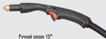
Ручной резак 15°